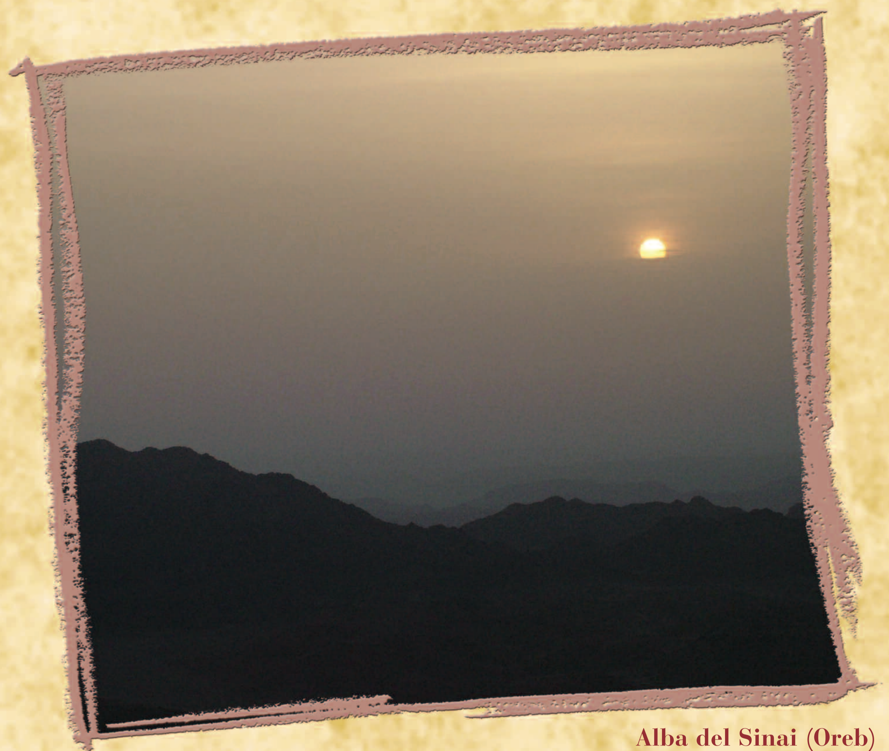
Alba del Sinai (Oreb) "Oltre il deserto, al monte di Dio, l'Oreb" (Es 3,1)