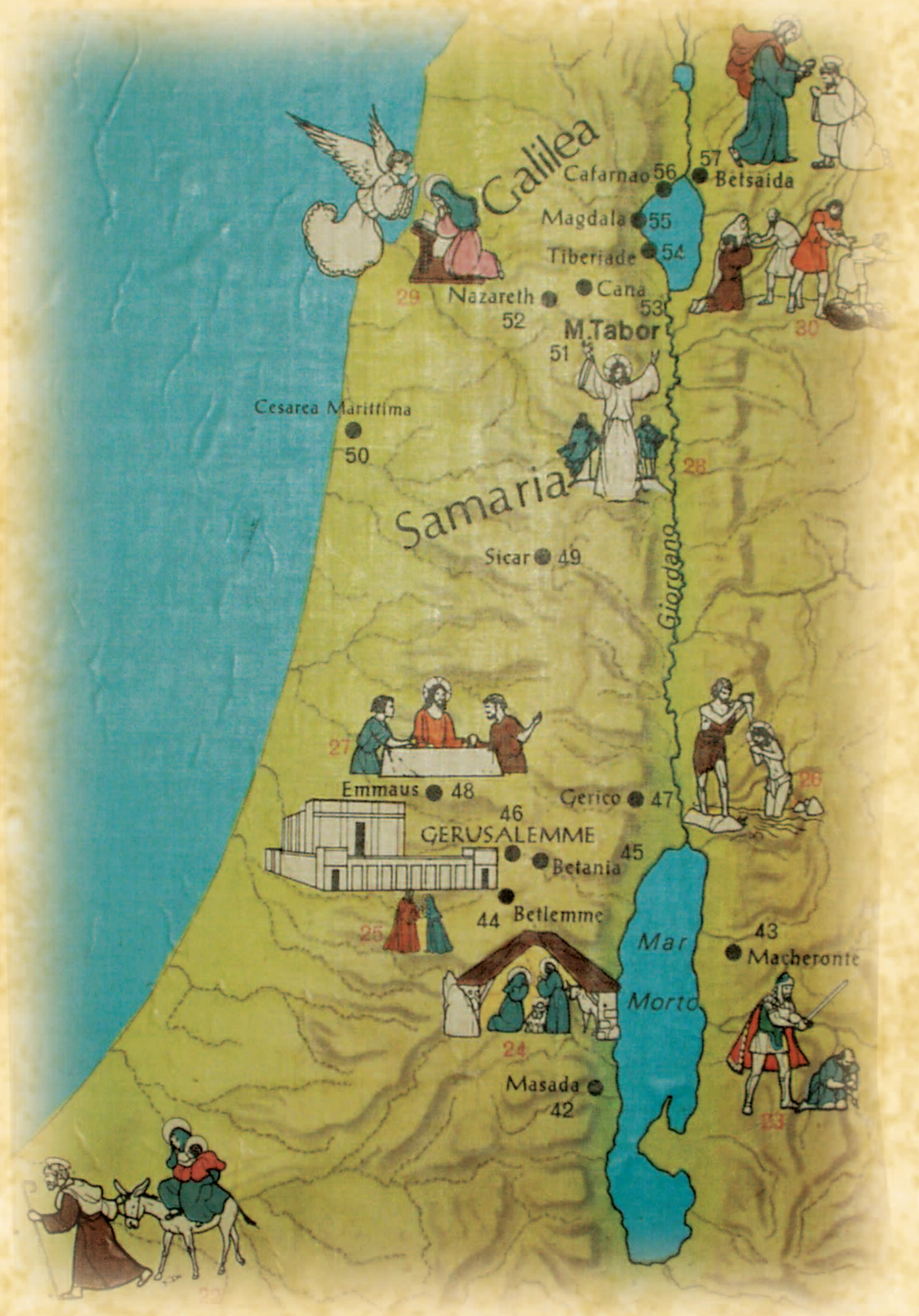
Cartina della Terra Santa

SULLE ORME DI GESÙ Dove Dio si è fatto uomo