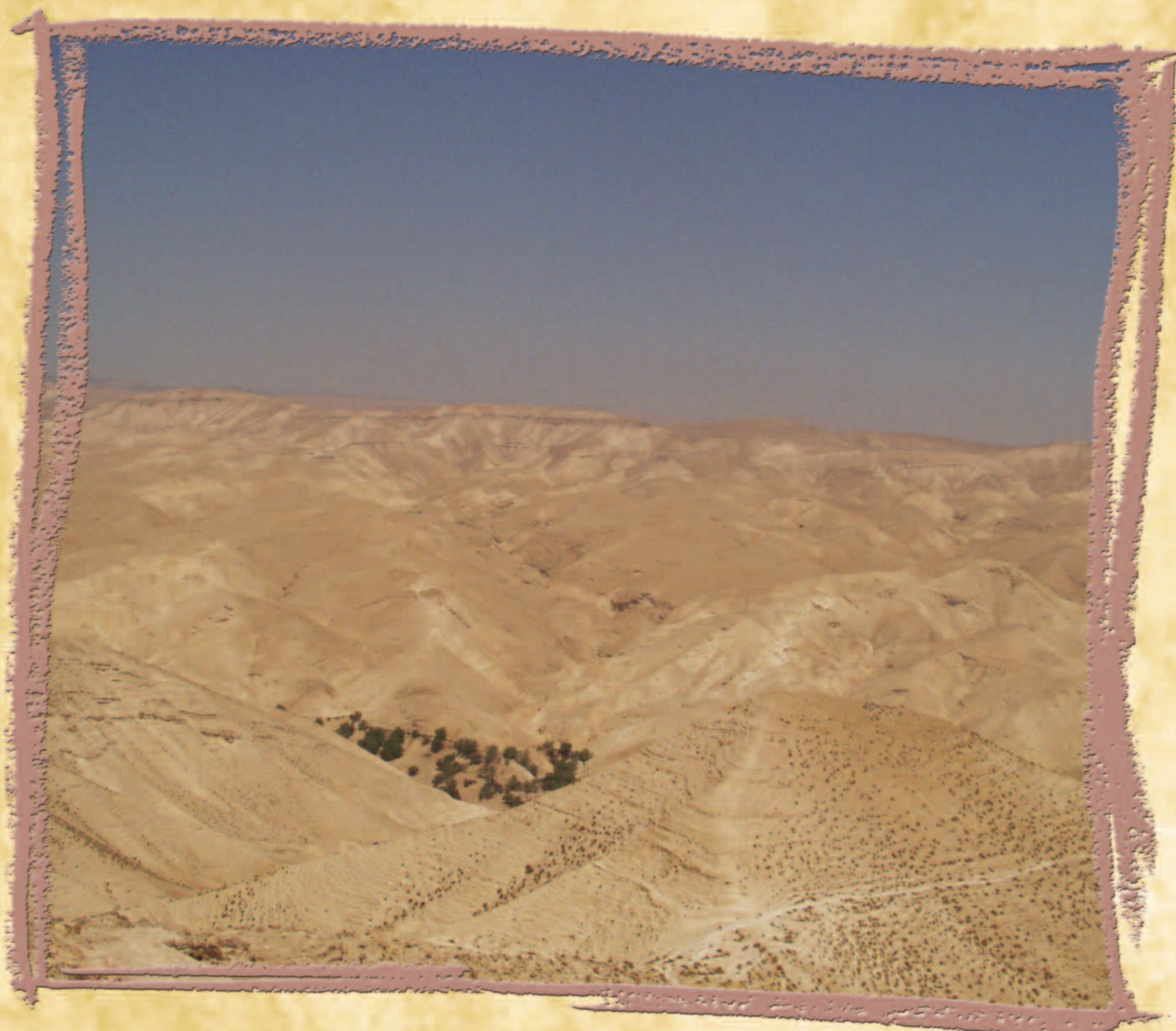
Deserto di Giuda