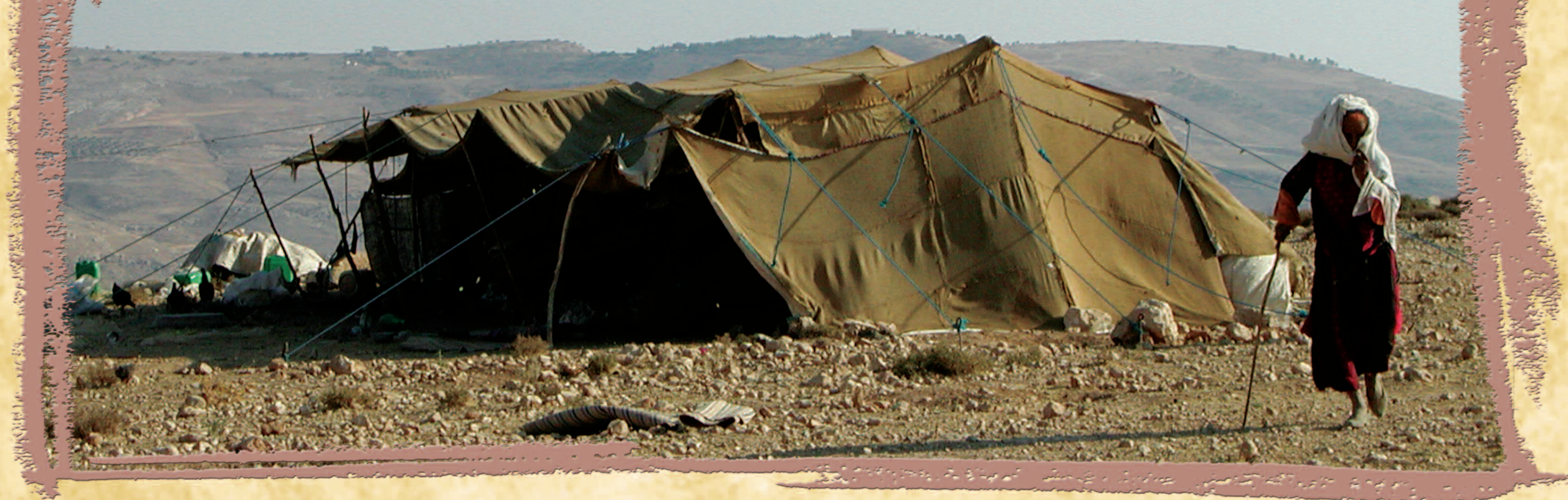
Tenda di Beduini nel deserto